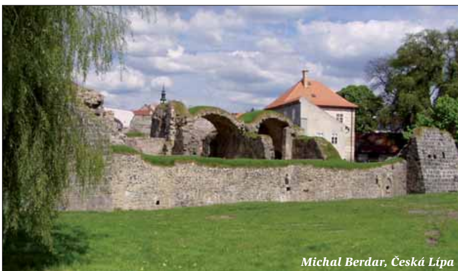
Michal Berdar, Česká Lípa