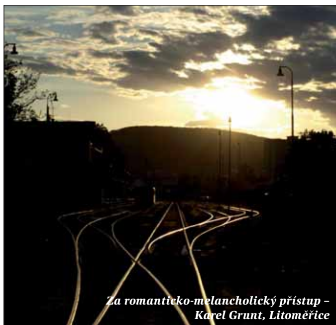
Za romantičko-melancholický přístup – Karel Grunt, Litoměřice