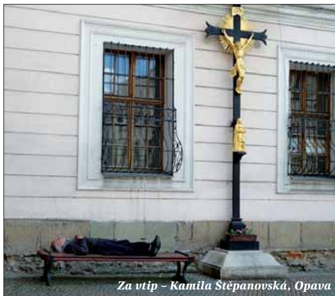
Za vtíp – Kamila Štěpanovská, Opava