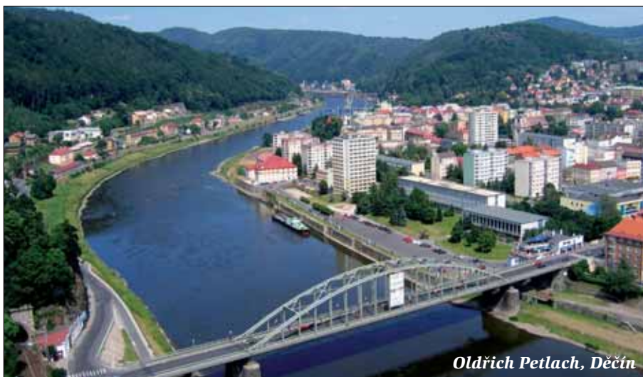
Oldřich Petlach, Děčín

Oldřich Petlach z Děčína popsal snímek pro návštěvníky místa přímo ukázkově: „Řeka Labe teče vlastně už od Hradce Králové Polabskou nížinou. Několik stovek kilometrů. Ale ouha, u města Lovosice se jí staví do cesty vysoké hory - České středohoří. Tímto čedičovým masivem si řeka musela prorazit cestu přes Ústí nad Labem až do našeho krásného Děčína, který leží v děčínské kotlině. Tady si Labe po cestě stísněným kaňonem trochu vydechne, ale jenom na malou chvilku. Před ním totiž stojí další masiv - pískovcové České Švýcarsko. A že si s ním řeka poradila, vidíte na této fotografii. Díváme se z Děčína po proudu Labe na sever - do vchodu Českošvýcarského labského kaňonu, z nějž se řeka dostane vlastně až v Německu u Drážďan.“