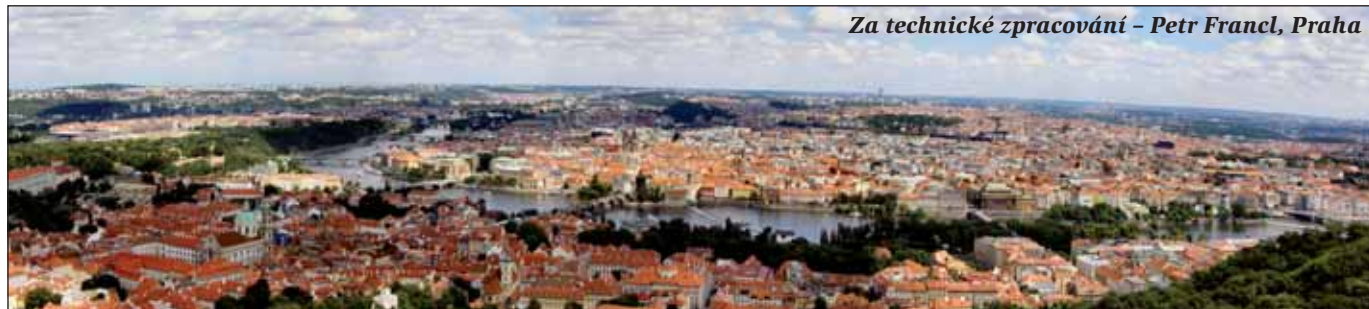
Za technické zpracování – Petr Francl, Praha