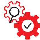
SPRÁVA A ÚDRŽBA

Pro vyřešení případných poruch jsme Vám k dispozici nepřetržitě 24 hodin denně, 7 dní v týdnu.