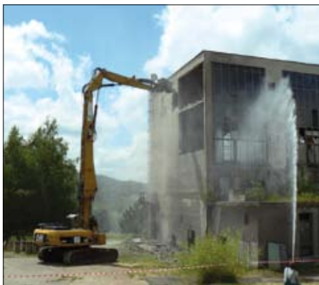
projektu. Projekt bude dokončen v létě roku 2011.

Spolu s realizací projektu COGEN II je v České Lípě také v plánu propojení soustav připojením sídliště Slovanka do systému výtopny LOOS a demolice bývalé uhelné kotelny Dukla. Demolice této, již dlouhá léta nevyužitá a chátrající budovy, byla prvním krokem k přípravě areálu