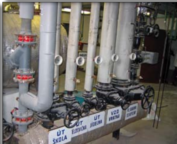
Stávající systém vytápění bude nahrazen novou technologií.