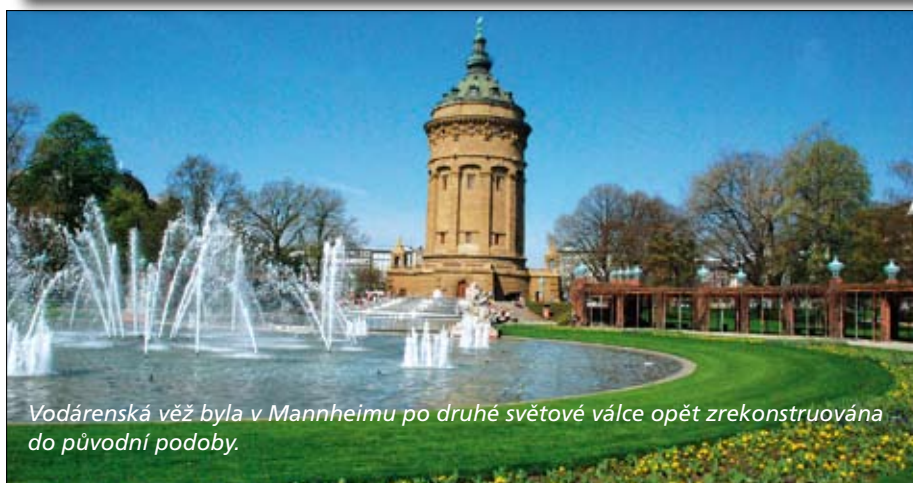
Vodárenská věž byla v Mannheimu po druhé světové válce opět zrekonstruována do původní podoby.

V létě roku 1999 vstoupila MVV Energie na český trh s energiemi a z původní společnosti EPS ČR s. r. o. zde postupně začala budovat skupinu MVV Energie CZ.